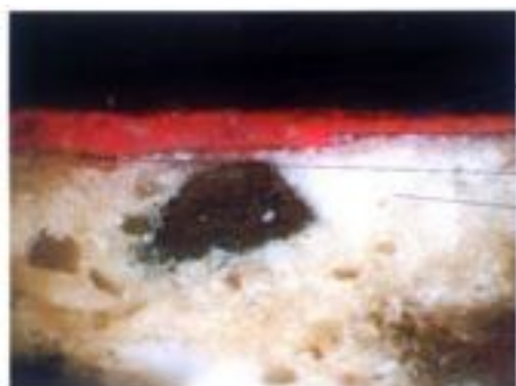
Fig.9 - Particolare dell'immagine precedente. Si osserva, come nel campione 1, la linea disegnativa.